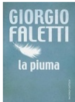
La piuma - Giorgio Faletti ACQUISTA