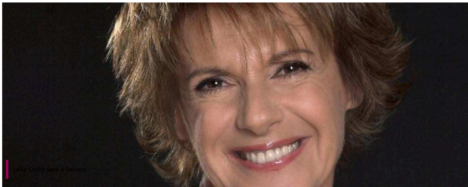
Lella Costa sarà a Seriate